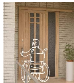
ドアリモ アウトセット玄関引戸 (YKK AP)