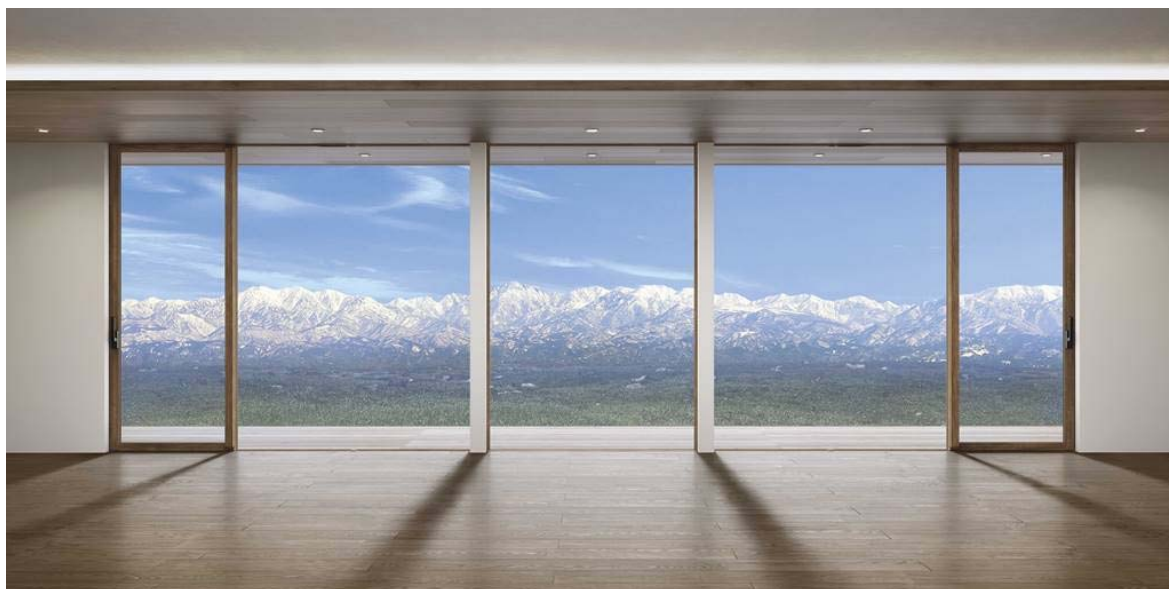
「APW 511」大開口スライディングを片引き窓+FIX窓+片引き窓の構成で並べて施工したイメージ

YKK AP株式会社（本社：東京都千代田区、社長：堀 秀充）は、圧倒的な眺望・採光・開放感と、高い断熱性を両立した住宅用窓「 エービーダブリュー APW 511」大開口スライディングを2019年6月25日から発売します。