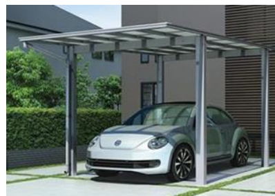
「エフルージュ ワン FIRST」施工イメージ

フラットな意匠はそのままに、安心感がある両側支持タイプの1台駐車用の幅 30 (3013 mm) の「エフルージュ ワン F I R S T」を新規設定。また、「エフルージュ ツイン F I R S T」にコンパクトサイズの幅 36 (3608 mm) を設定し、様々な敷地に柔軟に対応します。