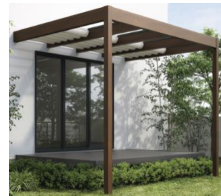
パーゴラ用 サンシェードカーテン