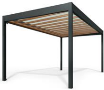
パネル屋根(軒天なし)