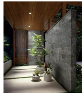
パネル屋根 軒天全面張り ダウンライト付き

また、アウトドアリビングに差し込む日差しを程よく調節し、過ごしやすい空間をつくり出す「サンシェードカーテン」の取付も可能。「サンシェードカーテン」は、雨風をしのげるパネル屋根下用と開放的なパーゴラ用の2種類を設定しています。