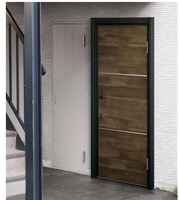
「ドアリモ アパートドア」 施工イメージ

「ドアリモ アパートドア」は、壁を壊さず今あるドア枠に新しいドア枠をかぶせて取り付けるカバー工法を採用する事で、 1日でもかたんに玄関ドアを交換できる 商品です。 バリエーションに富んだ9デザイン・13カラー から選択可能で、外壁を塗り替えてもどこか古さが残る外観を「ドアリモ アパートドア」で一新し、アパートの外観をリフレッシュする事で物件の資産価値向上に貢献します。