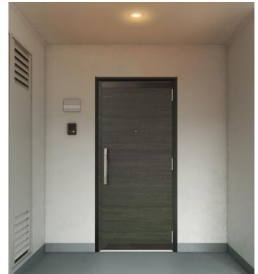
「ドアリモ マンションドア」 施工イメージ

マンションの開口部は共用部である事や修繕積立金での費用捻出が課題になることなどもあり、これまで改修が進んできませんでしたが、YKK AP はマンションの窓の戸別改修に特化した「ドアリモ 断熱窓 マンション用」（2020年発売）と、この度発売する「ドアリモ マンションドア」をセットでご提案し、「マンションの窓・ドアも当たり前に変えられること」を広く社会に発信し、ストック循環型で持続可能な社会の実現にむけ取り組んでいきます。