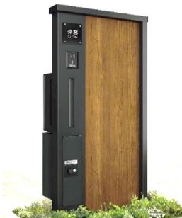
②ルシアス ウォール納まり