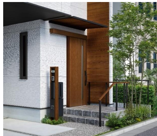
「シンプルオ 宅配ボックス 2 型」を「ルシアス ポストユニット HH02 型」に取付け