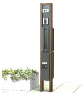
①ルシアス ポストユニット納まり