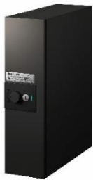
狭小地に設置しやすいコンパクトなサイズ設定

宅配ボックス本体は、扉を閉めた状態で幅 140 mm、奥行 400 mm、高さ 500 mm、扉を開いた状態で幅 209 mm、奥行 527 mmとコンパクトで狭小地にも設置しやすいサイズ設定です。扉の開き勝手は右勝手、左勝手をご用意し、宅配ボックスのすぐ近くに壁が立つような敷地でも敷地条件に合わせた選択が可能です。