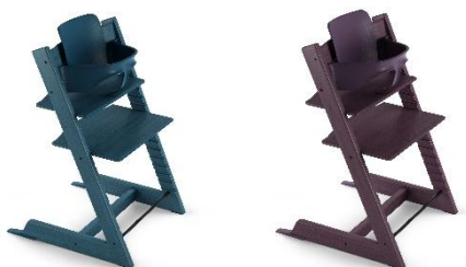
(写真左から、ミッドナイトブルー、プラムパープル)

高い背もたれとガードで赤ちゃんをしっかりと支える「トリップ トラップ ベビーセット」にも、「ミッドナイトブルー」、「プラムパープル」の2色を追加します。