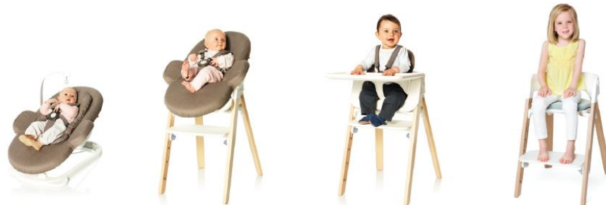
お誕生後すぐから

ストッケ ステップスのコンセプトは、快適さと安全性、サポートといった赤ちゃんに必要なニーズをすべて満たしながら、耐久性と高い品質を備え、アクティブな動きへのサポートと人間工学を取り入れたシーティングといった、幼児のために必要な条件も満たしています。