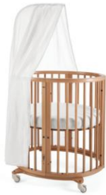
お誕生後すぐから

また、ストッケ スリーピーは 2004 年に優れたデザイン性のある製品に贈られるレッド・ドット賞を受賞しています。