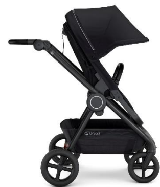
親子で同じ景色を(背面)