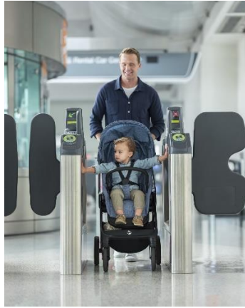
改札もスムーズに通過