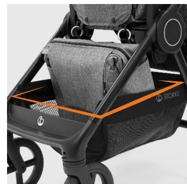
開口部が広い大容量バスケット