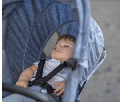
赤ちゃんに快適なシート