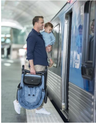
片手で持ち運べる