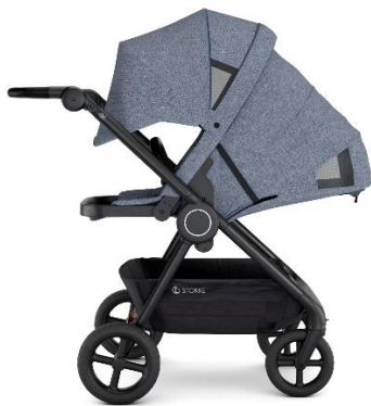
親子が向かい合って (対面)