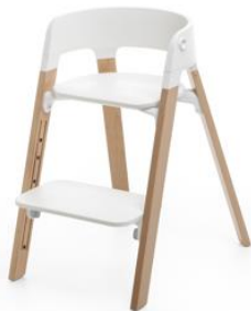
レッグ部：ビーチ材