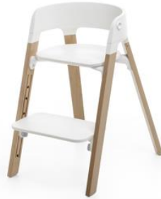
レッグ部：オーク材