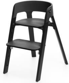
④ ステップスチェア オーク ブラック