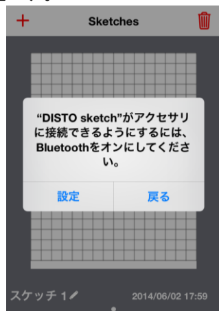
1. Bluetooth 接続

グリッドに図を描く代わりに、撮影した写真の上に線を引いて、その線上に測定値をスライドさせることも可能です。