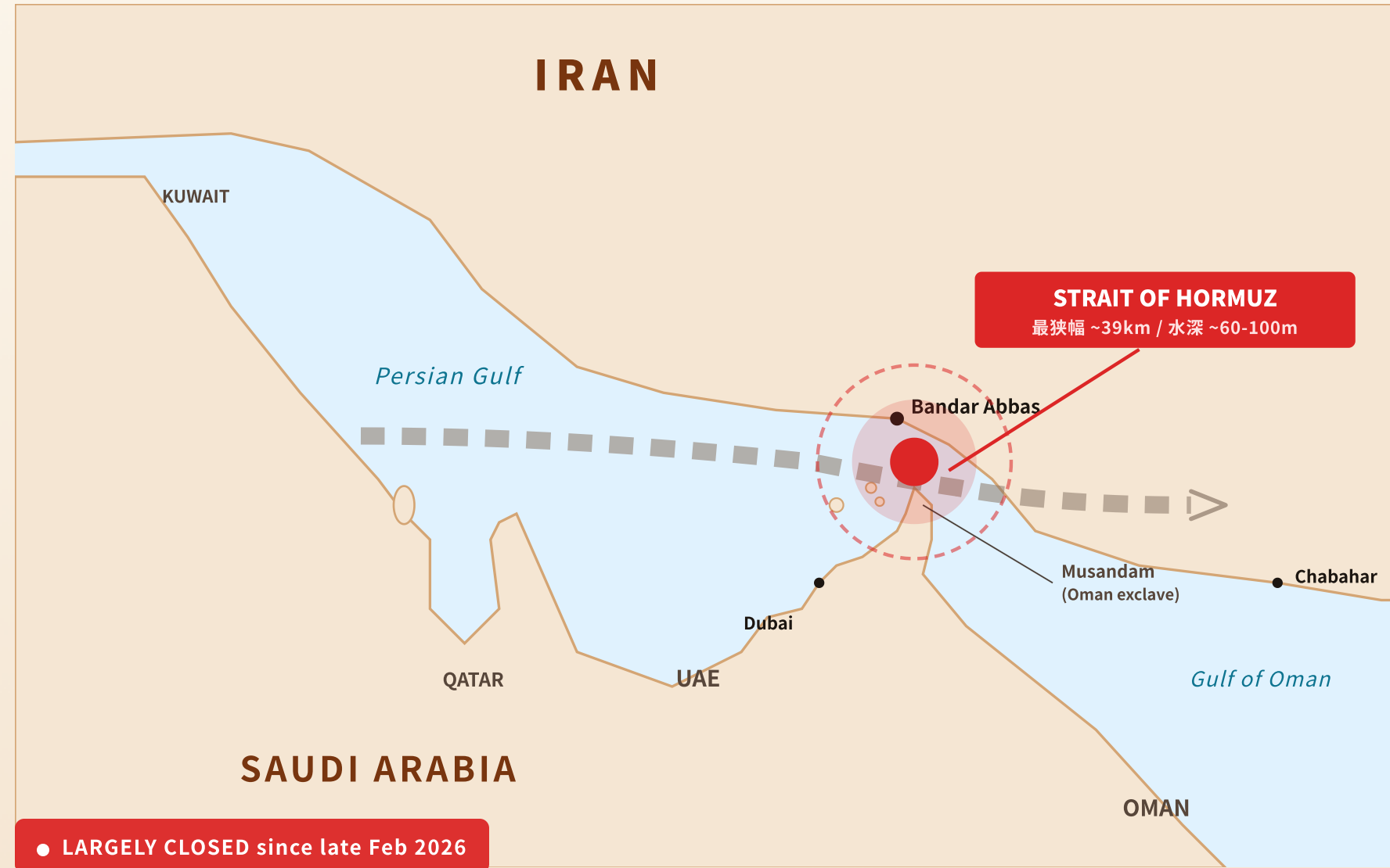
ホルムズ海峡周辺 - 主要原油輸出ルート

通常時は海上石油貿易の約25%(約20mb/d)、現在は2026年2月末から「実質閉鎖」状態。IEA推計で14mb/dが供給途絶