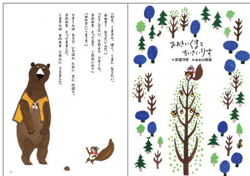
前半の絵本ページ