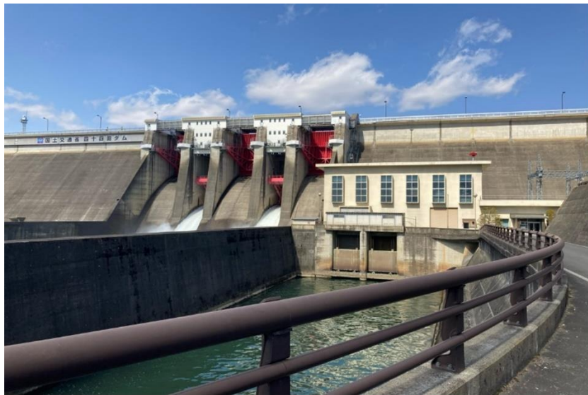
岩手県企業局の四十四田発電所(水力)

日立三菱水力株式会社(以下、日立三菱水力)と株式会社日立製作所(以下、日立)、株式会社日立産機システム(以下、日立産機システム)は、このたび、岩手県企業局の四十四田発電所(水力)の発電施設における保守・点検業務に対し、IoTやAI技術、現場メーターデータセンシングといったデジタル技術を活用したスマート化実証を行い、その第1フェーズを完了しました。