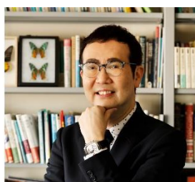
福岡 伸一氏 生物学者・作家