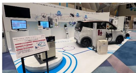
写真：体験型コンテンツのイメージ

(注) 上記のプログラムや登壇者は、変更となる可能性がございます。最新の詳細情報につきましては、公式サイトをご覧ください。