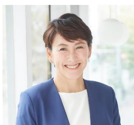
杉山 愛氏 スポーツコメンテーター・ 国別対抗日本女子テニス代表監督

異なるジャンルの第一線で活躍するプロフェッショナルがリーダーシップの要諦やパートナーシップの重要性について語る 2 つの「特別セッション」には、スポーツコメンテーター・国別対抗日本女子テニス代表監督の杉山愛氏、生物学者・作家の福岡伸一氏、戦略家・ marketer で(株)刀 代表取締役 CEO の森岡毅氏が登場します。さらに 13 件の「ビジネスセッション」では、日立がどのように社会課題を解決し、お客さまのビジネスに貢献しているか、協創パートナーや有識者を交えて議論します。詳しくは公式サイト の「セッション一覧」 をご覧ください。