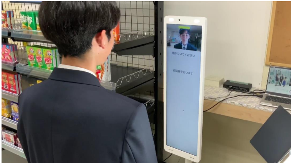
日立工業専修学校の生徒が CO-URIBA で最先端決済を体験する様子

地域社会の金融・DX リテラシー向上をめざし、茨城県内の他教育機関などにも展開予定