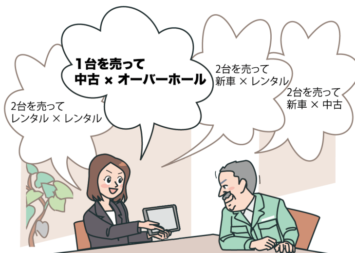
「営業支援アプリ」使用イメージ図

具体的には、AI の分析をもとに、「この機械は長期間使っているから更新時期が近いと思われる」、「稼働率が高い機械の現場に対し、購入またはレンタルによる増車の提案ができる」、「使用頻度が少ない機械は、買い取りを提案できる」など、お客さまの保有機械の状況に応じた提案を、アプリを活用するすべての担当者が行えるようになります。これにより、お客さまは中古車やレンタル車の並行した運用や、保有機械の中古車下取りなど、これまで以上に効率的な機械の運用方法を検討することができます。