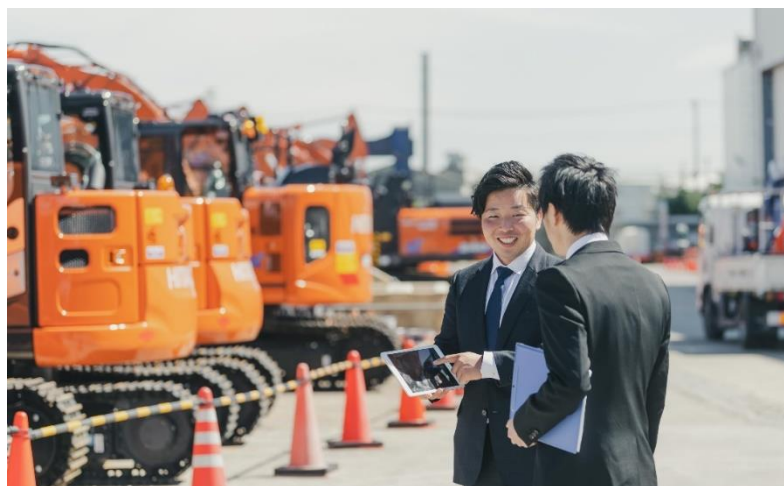
「営業支援アプリ」使用イメージ

日立建機株式会社(以下、日立建機)と株式会社日立製作所(以下、日立)は、日立建機のデジタルトランスフォーメーション(以下、DX)加速に向けて協創活動を行い、建設機械の稼働情報(OT*1 データ)や生産・販売・在庫情報など(IT データ)を一元管理し、データ利活用を促進するプラットフォーム「DX 基盤」(以下、本基盤)を構築しました。本基盤を活用することで、日立建機は、これまでシステムごとに管理していたさまざまなデータの収集から分析・利活用までのサイクルを効率化することが可能となり、お客さまにとって新たな価値の創出を推進します。