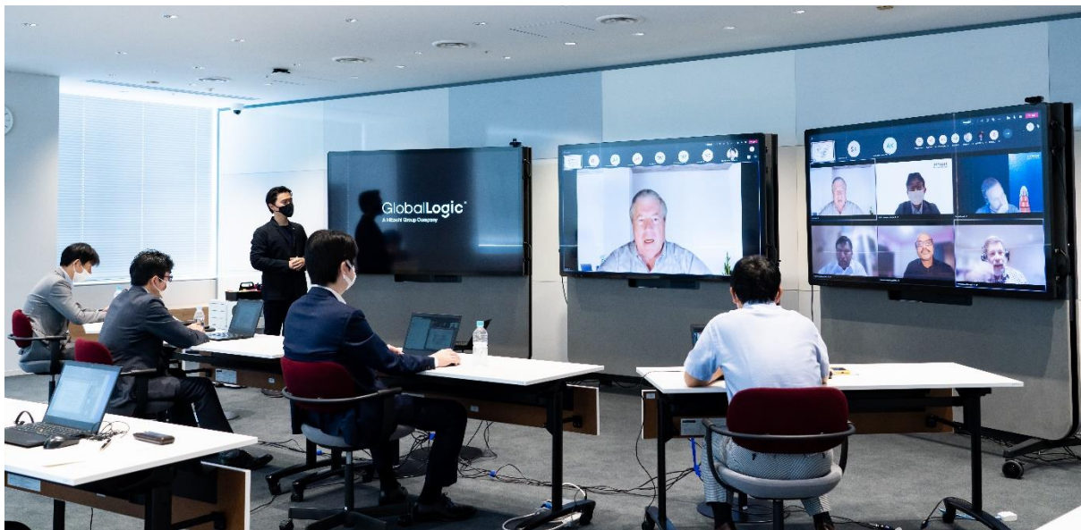
「Lumada Innovation Hub Tokyo」と GlobalLogic 社のデザインスタジオを接続したワークショップの様子

株式会社日立製作所(以下、日立)と米国子会社である GlobalLogic Inc.* 1 (以下、GlobalLogic 社)は、日本市場におけるデジタルトランスフォーメーション(以下、DX)サービスを推進するための協創を開始しました。この協創の取り組みは、日立の協創拠点「Lumada Innovation Hub Tokyo* 2 」を活用し、GlobalLogic 社と Lumada のケイパビリティを融合したものです。本取り組みは、両社の統合戦略に基づき、GlobalLogic 社の速やかな日本市場参入を実現するものです。