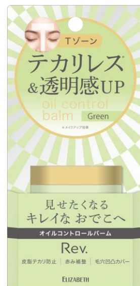
レヴ オイルコントロールバーム C 02