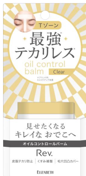
レヴ オイルコントロールバーム EX 01

Tゾーンのテカりを抑えるオイルコントロールバームが新登場！ 塗るだけで瞬間サラサラ 見せなくなるキレイなおでこへ。 肌悩みに合わせて選べる3タイプ。