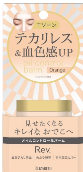
レヴ オイルコントロールバーム C 01