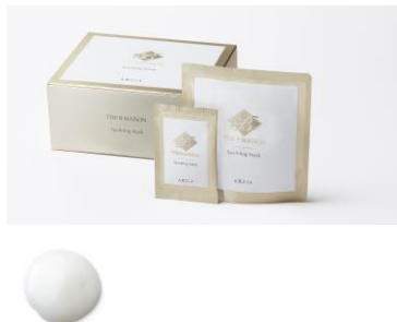
1料（顆粒状）と2料（ジェル状）を 混ぜたテクスチャー

10回分＜1料（顆粒状）4g×10包／2料（ジェル状）40g×10包＞ 税込¥14,080（本体価格¥12,800）