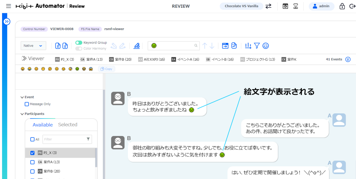
図1：絵文字閲覧機能（イメージ）