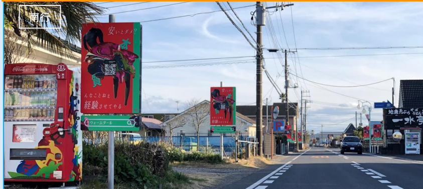
【屋外広告看板100面ジャック】