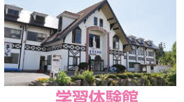
学習体験館 ルミエール

☎ 10:00~16:00(夏季9:00~17:00) 休 不定休 ☎ 0266-68-2017