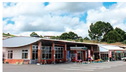
道の駅 「女神の里 たてしな」

☎ GW~12月30日/9:00~18:00 1月5日~4月/9:00~17:00 休 GW~12月30日/無休 1月5日~4月/毎週水曜日(12月31日~1月4日は休業) ☎ 0267-51-4100