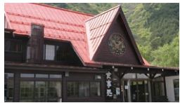
武石観光センター

☎ 8:00~17:00 休 11月下旬~4月中旬/月曜日 7月下旬~8月末/無休 ☎ 0268-86-2003