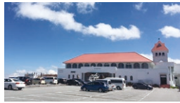
道の駅 美ヶ原高原