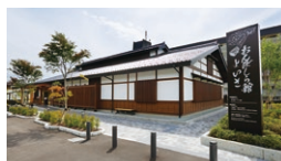
おんぼしら館 いよさ

☎ 9:30~16:30 休 11月中旬~4月下旬 ☎ 0266-52-7000