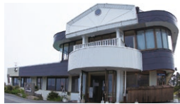
山本小屋 ふる里館