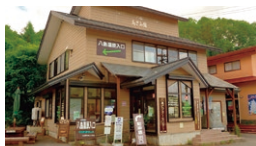
八島ビジターセンター あざみ館

☎ 9:30~16:30 休 11月中旬~4月下旬 ☎ 0266-52-7000