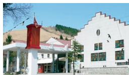
世界の影絵・きり絵 ガラス・オルゴール美術館

☎ 9:00~17:00 休 11/月上旬~4/中旬(冬期は休館) ☎ 0266-68-2100