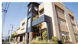
しもすわ今昔館おいでや (時計工房儀象堂)

☎ 9:00~17:00 休 年中無休(臨時休館有) ☎ 0266-26-0413