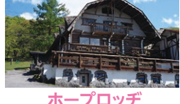
ホープロッジ 乗馬牧場

☎ 10:00~16:00(夏季9:00~17:00) 休 不定休 ☎ 0266-68-2017