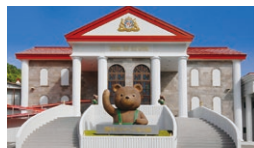
蓼科ティディベア 美術館

☎ 10:00~17:00(季節により変更有) 休 11月下旬~12月上旬に数日 ☎ 0266-68-2100