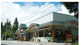
マンモス おみやげセンター

☎ 10:00~17:00(季節により変更有) 休 11月下旬~12月上旬に数日 ☎ 0266-68-2100