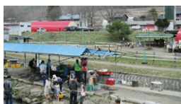
鷹山ファミリー牧場

☎ 9:00~16:30 休 団体貸切時(不定)/11月上旬~4月中旬 ☎ 0268-69-0550