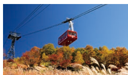
北八ヶ岳ロープウェイ 坪庭駅

☎ 7:30~19:30 休 年中無休(臨時休あり) ☎ 0266-67-2626