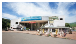
レイクサイドプラザ

☎ 9:00~17:00 休 11/月上旬~4/中旬(冬期は休館) ☎ 0266-68-2100