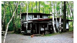
蓼科クラフトヴィレッジ 陶仙房

☎ GW~12月30日/9:00~18:00 1月5日~4月/9:00~17:00 休 GW~12月30日/無休 1月5日~4月/毎週水曜日(12月31日~1月4日は休業) ☎ 0267-51-4100