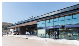
ローソン ビーナスライン白樺湖店