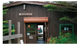
ころぼくるひゅって

☎ 4月~9月/9:00~18:00 10月~3月/9:00~17:00 休 年中無休(臨時休館有) ☎ 0266-28-3636