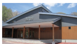
黒耀石 体験ミュージアム

☎ 9:00~16:30 休 団体貸切時(不定)/11月上旬~4月中旬 ☎ 0268-69-0550