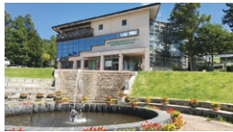
信州たてしな観光協会 (白樺高原総合観光センター)