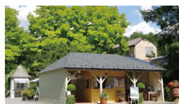
蓼科高原 バラクラ イングリッシュガーデン

☎ 8:00~17:00(夏期)(季節により運行時間変更有) 休 11月上旬~12月中旬まで連休期間有 ☎ 0266-67-2009