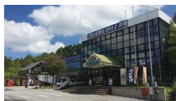
車山スカイプラザ・ ビジターセンター

☎ 3月~11月/9:00~17:00 12月~2月/9:30~16:30 休 年中無休(臨時休館有) ☎ 0266-27-0001