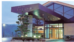
武石温泉 うつくしの湯

☎ 8:00~17:00 休 11月下旬~4月中旬/月曜日 7月下旬~8月末/無休 ☎ 0268-86-2003