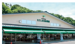
たてしな自由農園 茅野店

☎ 9:30~17:00 休 年中無休(冬季不定休) ☎ 0266-77-2019