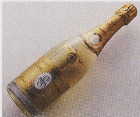
＜フランス・シャンパーニュ地方/ルイ・ロデレール＞ クリスタル・ブリュット 2005 (白発泡/1杯・30名様限り) 1,575円