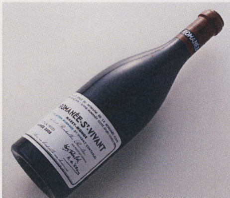
＜フランス・ブルゴーニュ地方/DRC＞ ロマネ・サンヴィヴァン 2008 (赤/1杯・30名様限り) 4,200円

11日(月) <チリ・マイポヴァレー/アルマヴィヴァ>アルマヴィヴァ 2010(赤/1杯) 840円