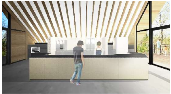
「CHAVATY HAKUBA (チャバティ白馬)」店内イメージ