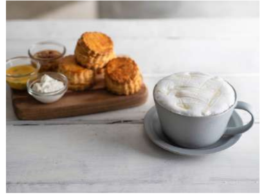
「CHAVATY HAKUBA (チャバティ白馬)」 提供メニューイメージ

当店は、45 m 2 のコンパクトな造りで、茶室のように限られた空間であるがゆえの安心感や心の拠り所を提供します。白馬の大自然の中でわび・さびを感じつつ、お茶を通して人と人のコミュニケーションや思考が広がるようにとの思いから森の中や芝生広場にゆっくり寛げる椅子を設置します。