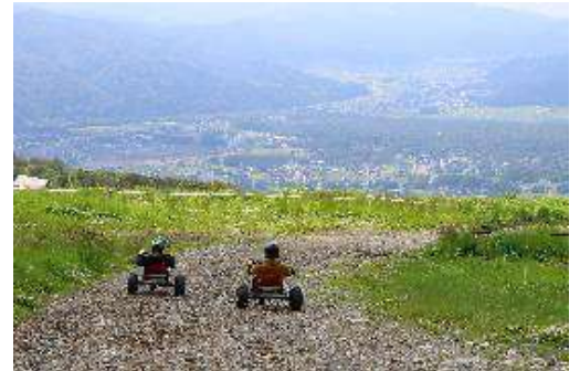
「Mountaincart（マウンテンカート）」イメージ

岩岳リゾートは、今後も四季の彩り豊かな自然の恵みを最大限に活用し、その素晴らしさを五感で味わえる体験を提供してまいります。