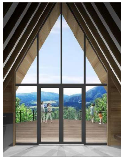
「CHAVATY HAKUBA（チャバティ白馬）」 テラスイメージ

CHAVATY は「Relax & Clear」をブランドコンセプトに掲げ、クオリティーシーズン・ウバを使用して一葉一葉を大切に丁寧に入れた「本物志向のティーラテ」をはじめ、今までになかった独創的なアイデアで新たなお茶の世界観を作り出す「オルタナティー」や、お茶とともに楽しむためのこだわりのスコーンから始まった「スコーンのある生活」の提案など、一杯のお茶から繋がっていく世界とそこから広がる新たな出会いや発見を大切にしながら、CHAVATY で過ごすひとときによって、日常がより豊かにより上質になることを目指した店舗展開をしています。