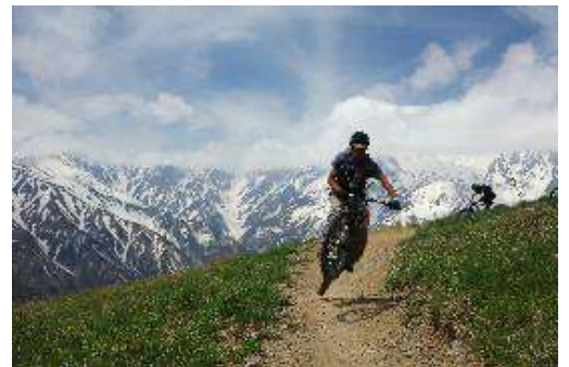
「白馬岩岳 MTB パーク」イメージ

景観と整備されたロングコースで人気の「白馬岩岳 MTB パーク」では、全長約 2,000m のフロートレイルをはじめ、初めて MTB にチャレンジする方にも適したコースを追加します。既存のコース以上