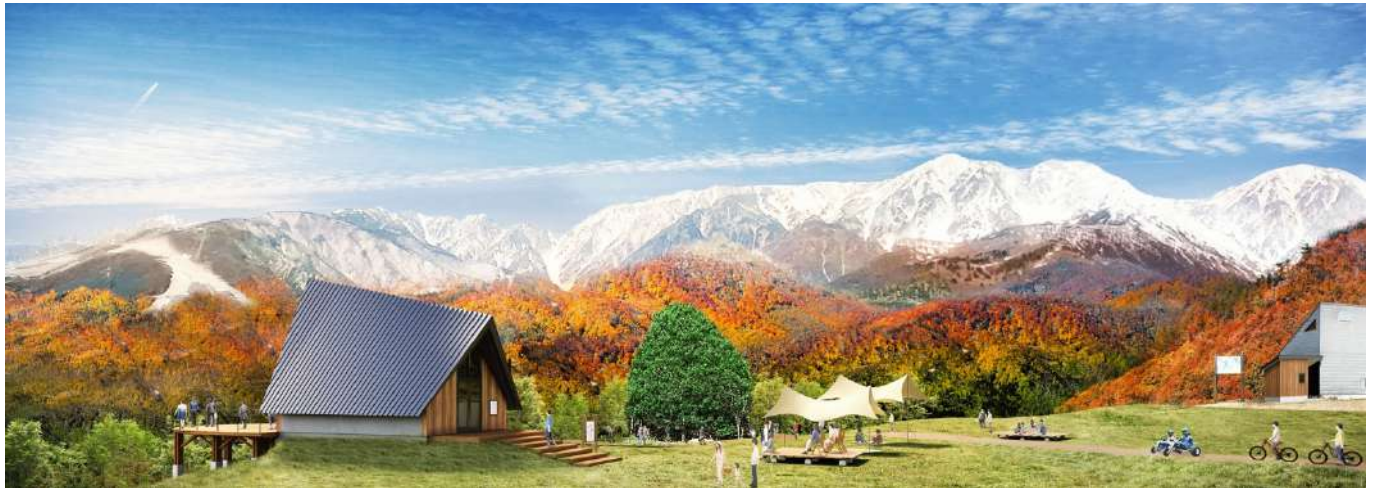
展望エリア「白馬ヒトトキノモリ」イメージ