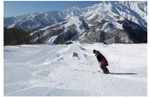
絶景が魅力のスノーパーク

スノーパークは昨シーズンに引き続き、今シーズンも絶景を眺める広大なサウスゲレンデに常設。キッカー・ウェーブ・レール・ボックスなど多彩なアイテムを充実させ、圧巻の冬景色のなか、レベルを問わず自分なりのスタイルで存分にトリックを満喫いただけます。