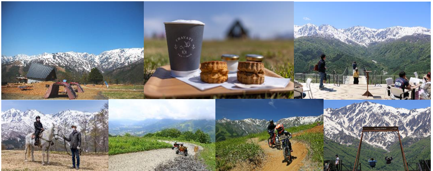
（左上から）白馬ヒトトキノモリ、CHAVATY HAKUBA のスコーンとティーラテ、HAKUBA MOUNTAIN HARBOR、乗馬アトラクション、マウンテンカート、マウンテンバイク、ヤッホー！スウィング presented by にゃんこ大戦争

新型コロナウイルス感染症に伴う緊急事態宣言が発出されていた2021年における同期間での来場者数7,200人に対しておよそ2.4倍に相当し、コロナ禍前の2019年GWと比較してもおよそ1.4倍となっています。