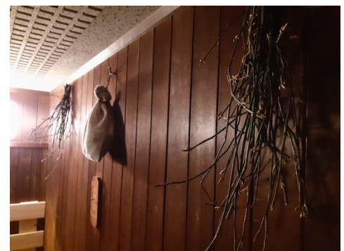
「クロモジサウナ」の内観（イメージ）

より多くの方々にリフレッシュしていただきたいとの思いから、館内の一部をリニューアルし、「クロモジサウナ」を12月16日（金）よりオープンします。長野県産クロモジを使ったサウナでは、すっきりと爽やかでスパイスのような奥深い香木の香りを感じながら汗を流せます。また、雪国ならではの整い体験として、雪に囲まれた空間でクールダウンができます。