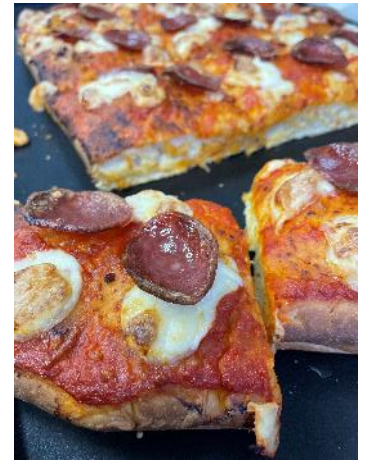
新商品「フォカッチャピザ」

北アルプスを一望する絶景テラス&カフェ「HAKUBA MOUNTAIN HARBOR（白馬マウンテンハーバー）」に併設するNY発の人気ベーカリー「THE CITY BAKERY」で2018年のオープン時から提供を続ける「プレッツェルクロワッサンサンド」（1,188円）は、一番人気の看板商品です。白馬豚、ツナ、たまごの3種から選ぶことができ、ランチやウィンタースポーツ後の休憩時の食事にもおすすめです。今シーズンは、新メニューとして「フォカッチャピザ」（660円）を数量限定で提供予定。独自に配合した生地からトマトソースまで手作りし、その上にサラミとチーズが乗った食べ応えのある一品です。