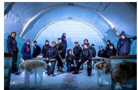
「Yoo-Hoo! Ice Slider」を制作する 糸冬工藝社

スウェーデンの「ICEHOTEL」で雪と氷の制作技術を学び、「Niseko Ice Village」内の「ICEBAR NISEKO」や「SAPPORO YUKITERRACE」などの製作を手がけた、濱口絹道氏と大内拓氏による、雪と氷専門のクリエイティブ会社である糸冬工藝社が製作を担当します。