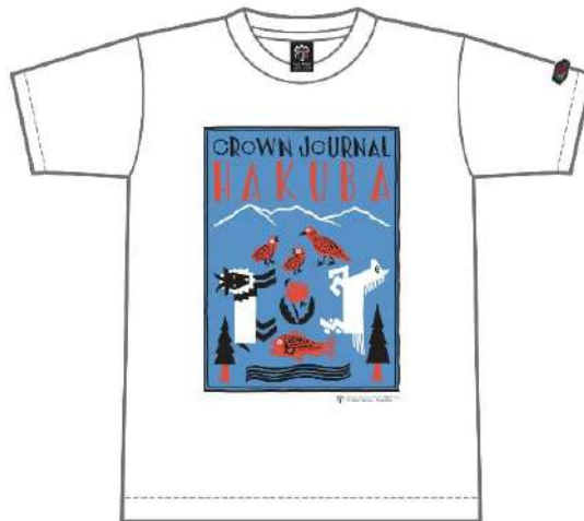
オリジナル T シャツ（イメージ）

日本スキー場開発グループの株式会社岩岳リゾート（本社：長野県北安曇郡白馬村、代表取締役社長：星野裕二、以下「岩岳リゾート」）が運営する「白馬岩岳マウンテンリゾート」は、岩岳オリジナル T シャツ「Fruit of the Loom×HAKUBA」の限定コラボ T シャツを 2024 年 10 月 2 日（水）より発売いたします。その他、紅葉シーズンのご来場をよりお楽しみいただくために、期間限定グルメや人気アクティビティが乗り放題になるセットなどを期間限定で順次販売開始いたします。