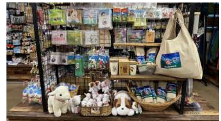
売店内グッズ販売コーナー