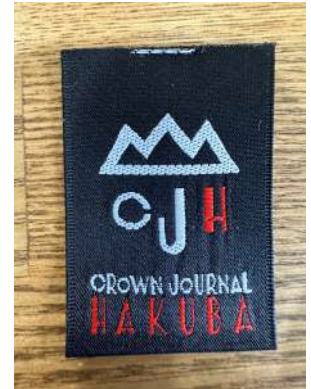
オリジナル T シャツの首タグ

フルーツオブザルームは、1851 年にアメリカで創業されたアパレルブランドで、シンプルで高品質な T シャツやアンダーウェアを中心に製品を展開しています。独自の耐久性と快適な着心地が特徴で、幅広い年齢層に支持されています。ブランドの象徴であるカラフルなフルーツのロゴは、多くの人々に親しまれ、長い歴史を通じてカジュアルウェアの定番として確立されています。また、環境への配慮や持続可能な素材の使用にも取り組んでおり、時代に合わせた進化を遂げています。