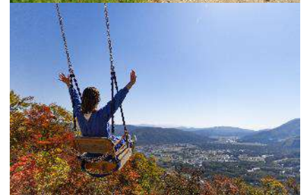
（上写真）マウンテンカート