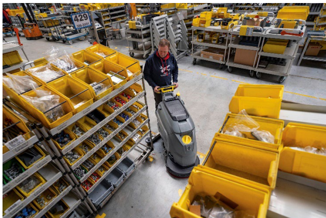
世界で最も使われているケルヒャーのスタンダードモデル（手押し式自動床洗浄機 BD 50/50 C Classic Bp）