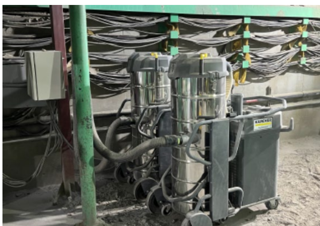
粉塵回収を効率化（セントラルバキュームシステムソリューション）