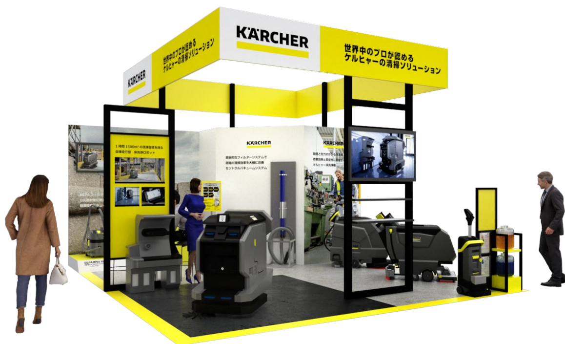
名古屋 ものづくり ワールド ケルヒャーブースイメージ