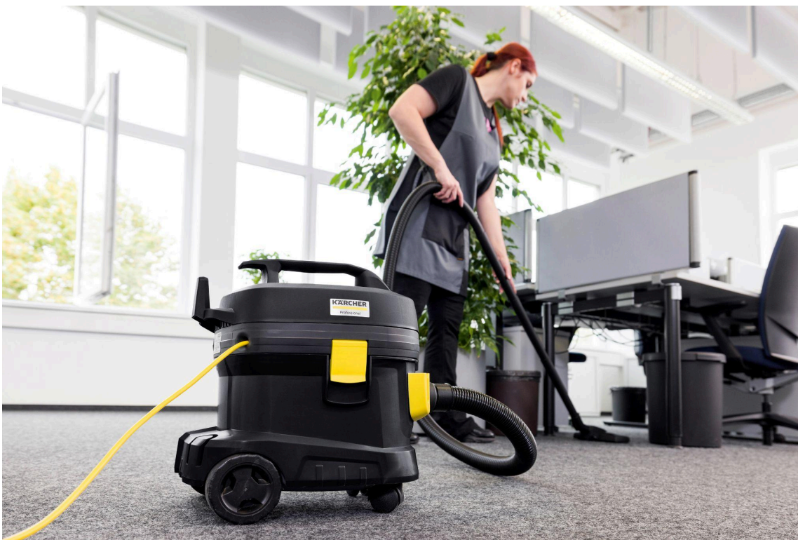
ドライクリーナー「T 11/1 Classic Re!Plast」

清掃機器の世界最大手メーカー、ドイツ・ケルヒャー社の日本法人、ケルヒャー ジャパン株式会社（本社：神奈川県横浜市港北区、代表取締役社長：大前勝己）は、本格的に再生プラスチックを使用した日本初（※1）の業務用掃除機となる環境配慮型ドライクリーナー「T 11/1 Classic Re!Plast」を2025年11月1日より予約販売受付開始いたします。