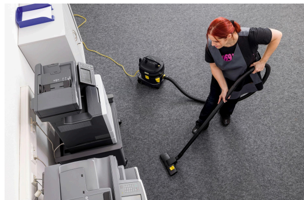
タフな設計で、業務にしっかり対応