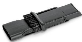
ブラシ付きすきまノズル