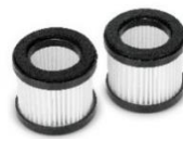
HEPAフィルター2個入 ※2022年12月上旬発売予定