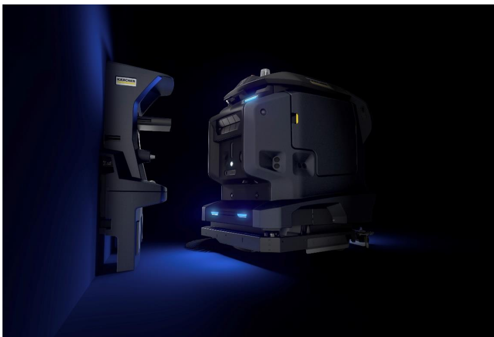
自律走行型 床洗浄ロボット KIRA B 50

清掃機器の最大手メーカー、ドイツ・ケルヒャー社の日本法人、ケルヒャー ジャパン株式会社（本社：神奈川県横浜市港北区、代表取締役社長：マーク・ヴァン・インゲルゲム）は、最先端の機能と技術を搭載した床洗浄ロボット KIRA B 50 を「よいロボットの日」をかけた 4 月 16 日（日）より発売を開始します。