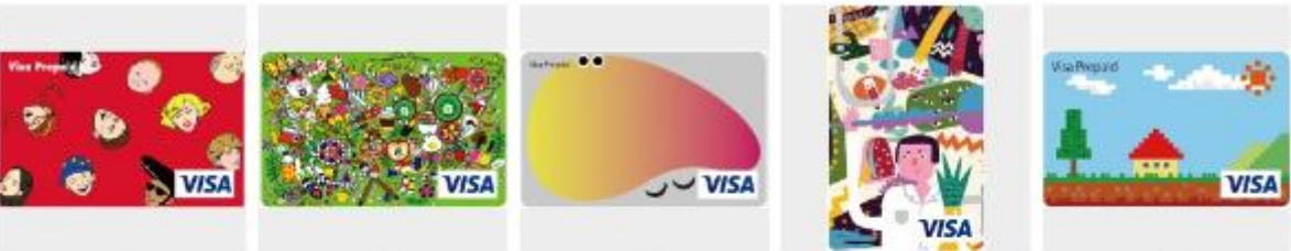
HA HA HAI Happy Life 財布の中の生き物 happy day ゲームの世界