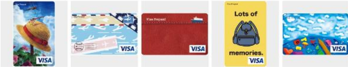
昆虫採集 world travel 共に旅する Lots of memories. 空の裏で