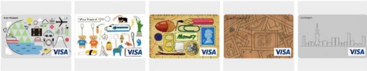
DreamTravel おみやげのおとも めもりーカード 思い出いっぱい 竹の街並み