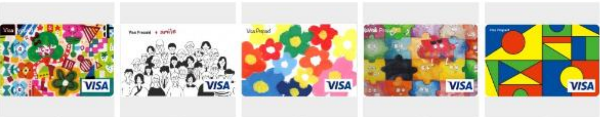
flower Happy smile 花 梅がけ旅行 TUMIKI CARD