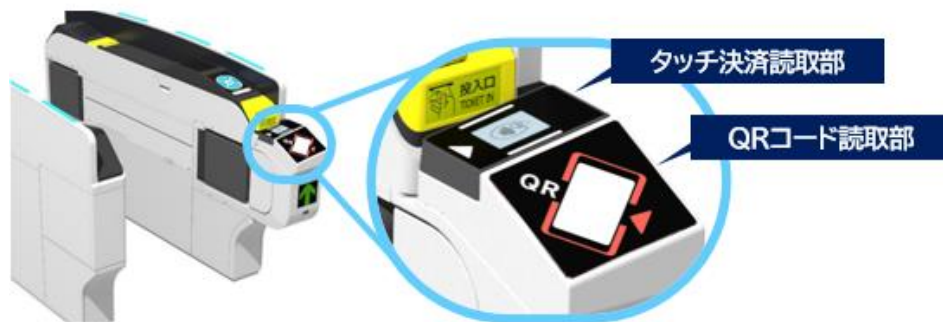
自動改札機のイメージ

実証実験の開始にあたり、西武線内の対象駅の自動改札機にタッチ決済読取部を搭載すると同時に、QRコード(※)の読取部も搭載します。これに伴い、2022年9月よりサービスを開始しているデジタル企画乗車券についても、対象駅で自動改札機を通過できるようになり、これまで以上に便利にご利用いただけるようになります。