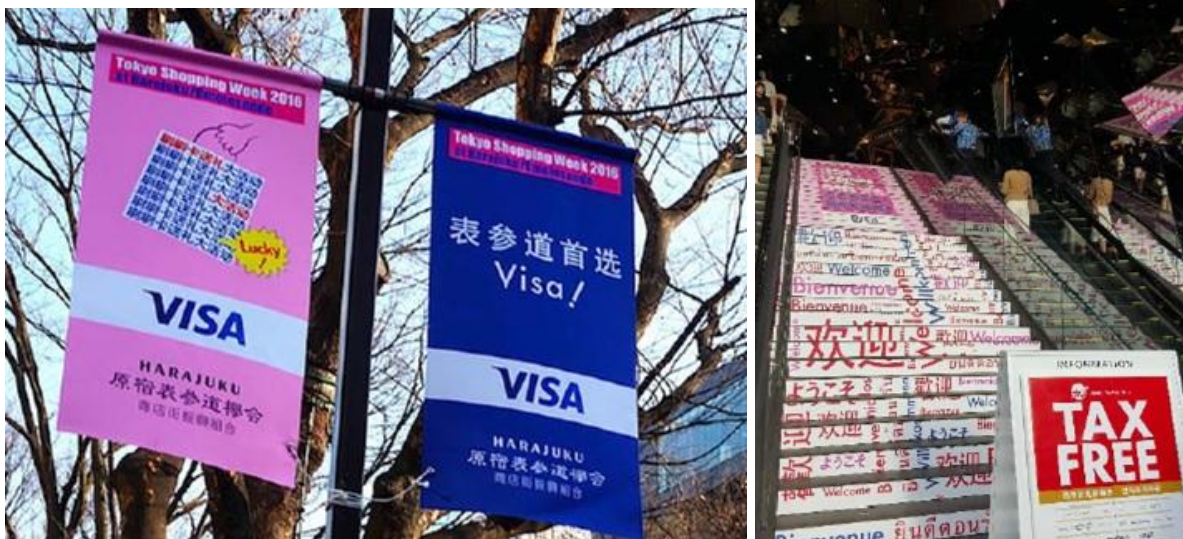
【原宿表参道櫛通り/昨年度実施風景】

本年度開催5回目となる札幌では、世界中から多くの観光客が来場する「さっぽろ雪まつり」の開催期間及び旧正月時期を含む2017年1月16日から3月31日まで、ショッピングを対象としたエリアキャンペーンを実施いたします。土地柄、移動距離が長くなる北海道においては、札幌中心部のみならず、全道への観光拠点となる近郊の集客施設との連携を深めることが重要となるため、今回は北海道が持つ豊かな資源・魅力をアピールする北海道全域を対象としたキャンペーンを実施いたします。