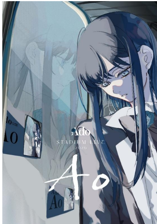
「Ado STADIUM LIVE 2026 Ao」のメインビジュアル