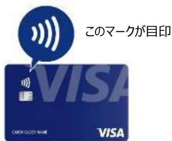
〔対応カードの一例〕

バス車載運賃箱に、Visa のタッチ決済の読取機器を設置します。Visa のタッチ決済に対応したカード（クレジット、プリペイド、デビット）をかざしていただくことで運賃をお支払いいただけます。大人運賃及び小児運賃に対応しています。