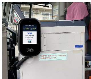
タッチ決済に使用する「LV700」の設置イメージ

ご乗車時に乗務員にご申告の上、バス車内に設置する Visa のタッチ決済用の端末機に、Visa のタッチ決済対応カードまたはスマートフォン等をかざすことでご利用いただけます。