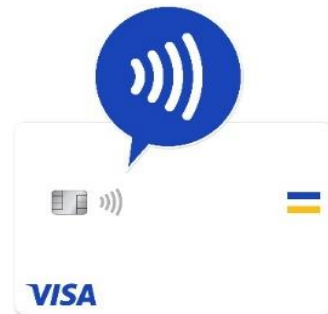
Visa のタッチ決済対応カードの目印

本実証実験では、レシップが提供するキャッシュレス運賃収受器「LV-700」を車内に設置し、乗車時にお客さまがお持ちの Visa のタッチ決済に対応したカードまたはスマートフォン等を同収受器にかざすだけで決済が完了し、バスにご乗車いただけます。