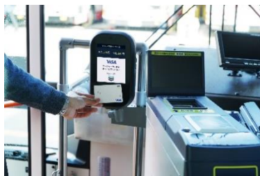
専用機器（イメージ）

江ノ島電鉄グループは今回の取り組みにより、今後更なる回復が見込まれるインバウンドの方々を中心に、公共交通をご利用いただく方々の利便性向上を図ります。