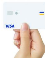
Visa のタッチ決済対応カード