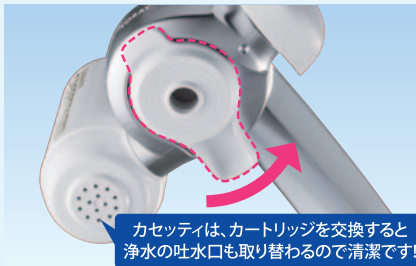
カセットィは、カートリッジを交換すると 浄水の吐水口も取り替わるので清潔です!