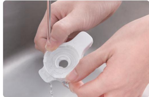
吐水口キャップは 右に回すと外せます。