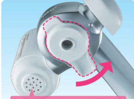
カートリッジを交換すると 浄水の吐水口も取り替わるので清潔です!

浄水器で特に汚れが気になる底面に、「吐水口キャップ」を搭載。「吐水口キャップ」はカンタンに外して洗うことができます。水栓蛇口から浄水器を外さなくても、手軽にお手入れをすることができるので、いつも清潔でキレイな状態でご使用いただけます。