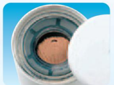
使用後(例) 鉄サビが多い場合