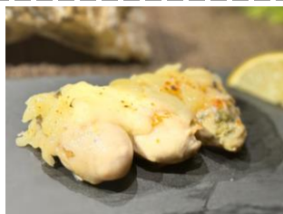
かきとラクレット チーズホイール焼き ＜南北海道地産物流協 同組合＞

肉厚のホタテの貝柱を贅沢に使用。ピリ辛のチゲスープがホタテの甘みを引き立てる一杯。