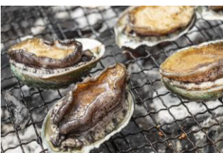
岩手・釜石直送 あわびの浜焼き ＜和海味処 ふう鈴＞

「こんなに大きなツブは見たことない！」といわれる迫力あるツブ貝をじっくり煮込んでご提供。やわらかな食感もお楽しみください！