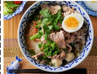
常磐もの鮮魚の 貝たくさん タイラーメン ＜トムボーイ＞

行列のできる人気店の新作。常磐産金頭の煮干し、福島産2種類をブレンドして熟成させた味噌を使い濃厚でコクのある味わいに。麺もチャーシューも地元産の福島尽くし！