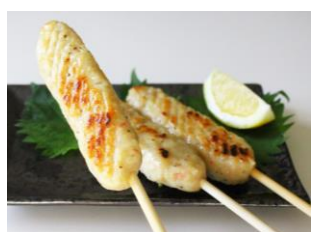
エビ入りつくね ＜石巻魚市場買受人 協同組合青年部＞

三陸・岩手の漁師直営の和食店。11、12月にしか漁ができない岩手の鮑は山々からの栄養を取り込んだワカメやコンブを餌とし旨味タップリ！