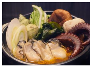
三陸海鮮チゲスープ ＜三陸BETCHA！＞

国産の鶏肉を使用したつくねに、海老を混ぜ込みました。プリッとした食感と海老の旨味がたっぷり楽しめる美味しいつくねです。