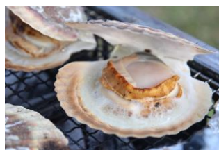
ホタテのバター 醤油焼き ＜青森県漁業協同組合 連合会＞

北海道知内産のカキをホイール焼きにし、ラクレットチーズをのせ、トロトロになるまで炙りました。