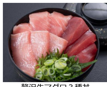
贅沢生マグロ3種丼

紀州・和歌山のマグロ専門店「和歌山 黒潮市場」が出店。生マグロの水揚量日本一を誇る勝浦漁港で、マグロを知り尽くしたプロが水揚げされたばかりの生本マグロの中から、脂がのったものを厳選して調達し会場に直送。来場者の目の前で解体し、さばきたての超新鮮な海鮮丼やお寿司を提供します。お薦めは大トロ、中トロ、赤身が食べ比べられる「贅沢生マグロ3種丼」。さばきたてのマグロの味わいは格別です。