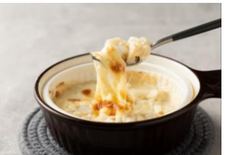
宮城県石巻市産 ホタテグラタン ＜Bon Quish＞

岩手・三陸産の海産物をたっぷり使った体の芯から温まるピリ辛なチゲ。漁師さんから直仕入れなのでとても新鮮。まさに食べる「三陸スープ」！