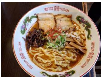
常磐煮干し濃厚味噌 中華そば ＜麵処ひろ田製粉所＞

行列のできる人気店の新作。常磐産金頭の煮干し、福島産2種類をブレンドして熟成させた味噌を使い濃厚でコクのある味わいに。麺もチャーシューも地元産の福島尽くし！