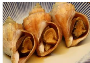
北海道産煮つぶ ＜美瑛なごみの 森厨房＞

緑豊かな山林からミネラル豊富な湧水が流れ込む陸奥湾で育まれた旨味たっぷりのホタテを、バター醤油で美味しく焼き上げました。