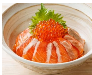
メイプルサーモンの 親子丼