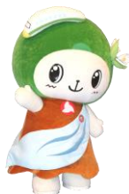
ニシゴーン (福島県西郷村)