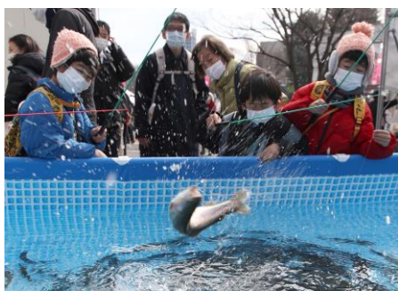
「ますつり公園」出張ニジマス釣り堀