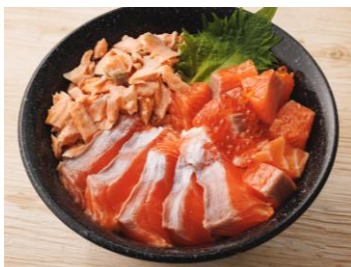
メイプルサーモンの 贅沢3種丼