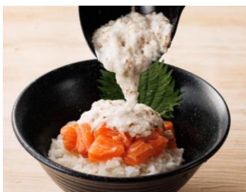
おろしたてとっとり芋の メイプルサーモン山かけ丼