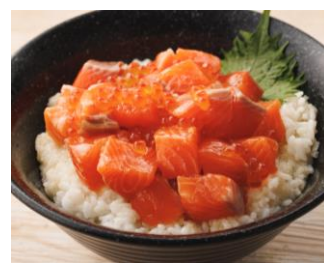
メイプルサーモンの 魅惑のタレ漬け丼