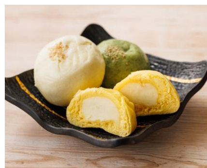
ポテトまんじゅう

福島県の玄関口に位置し、豊かな自然に恵まれ、首都圏からのアクセスも抜群の福島県西郷村が昨年につき、今年も出店します。西郷村は、日本の「村」では唯一、新幹線の駅があり、魅力的な観光スポットやおいしいグルメも盛りだくさんです。村の特産品である阿武隈川の清流で丹精込めて育てられた「メイプルサーモン」の海鮮丼は昨年、連日完売の大人気でした。今年も新メニューも加え、販売食数を大幅に増やします。新メニューは、特産品の「とっとり芋」をお客さんの目の前ですりおろし、たっぷりとかける「おろしたてとっとり芋のメイプルサーモン山かけ丼」。昨年、満員御礼の大好評だった村の観光名所である「ますつり公園」の出張ニジマス釣り堀を今年も設けます。マルシェブースでは、村の名物グルメ「ポテトまんじゅう」を、ホカホカでお召し上がりいただけます。