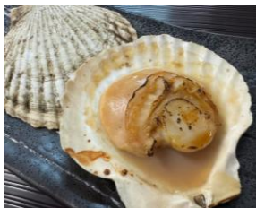
ホタテ応援隊 の殻付きホタテ浜焼き