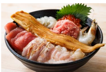
ノドグロ入り ふくしま全部のせ8種丼