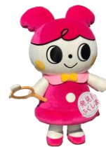
めっけちゃん (発見！ふくしま 公式キャラクター)