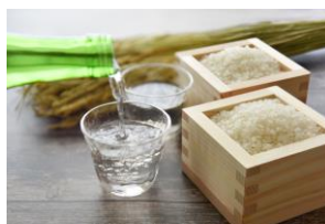
福島の地酒 飲みくらべセット ＜福島県酒造 協同組合＞

「常磐もの」の海鮮をたっぷりを使い、鶏ガラの濃い旨味が効いたタイ風ラーメン。海鮮だけでなく、肉や野菜も鮮度抜群な福島県産尽くし！