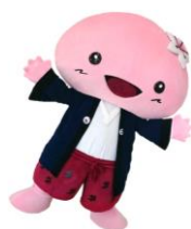
しみちゃん (福島県葛尾村)