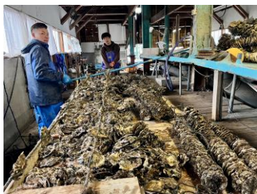
被害を受けた作業場で出荷再開の準備を急ぐ三次水産