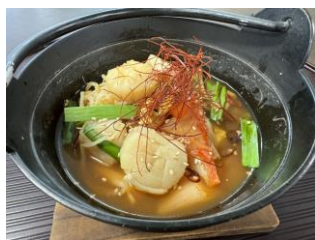
ホタテのキムチチゲ ＜ホタテ応援隊＞

肉厚のホタテの貝柱を贅沢に使用。ピリ辛のチゲスープがホタテの甘みを引き立てる一杯。