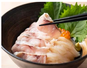
ノドグロ炙りと ヒラメ漬け丼