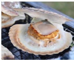
青森県漁業協同組合連合会 のホタテバター醤油焼き

北海道、青森、宮城のホタテ料理が味わえるブースが多数出店します。殻付きの浜焼きやバター醤油焼き、串焼き、ホタテグラタン、ホタテチゲ、ホタテラーメンなどバラエティ豊かなメニューをご用意。中国による日本産水産物の輸入停止の影響を受けているホタテをたくさん食べて応援してください。