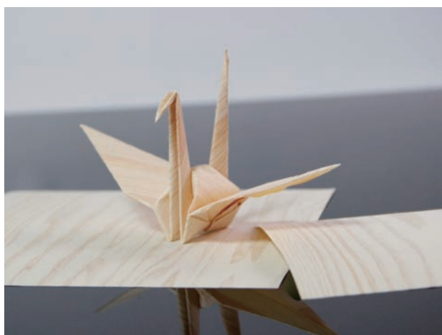
←薄さ 0.1mm 京乃木肌で作った折り紙です。