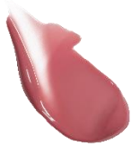
W001 New Allure ニューアリュール