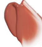
W009 Rare moment レアモーメント