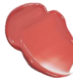
W004 Ambient アンビエント