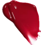
W008 Classical クラシカル