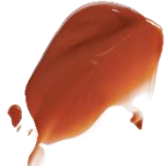
W007 Gifted ギフトッド