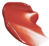
W003 Harmonious ハーモニアス