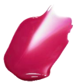
W005 Influence インフルエンス