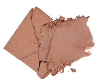
アット・ザ・モーメント At The Moment