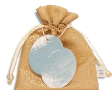
オーガンジーミニポーチ (イエロー)

※楽天、Qoo10においてもお得なキャンペーンを実施します。詳細は各サイトをご参照ください。