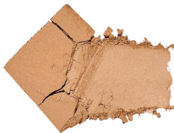
イン・ミッドサマー In Midsummer