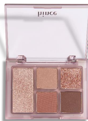
03 Fall in rose フォール・イン・ローズ

秋の夜、優しいロマンが込められた ほのかで奥ゆかしい魅力を持つ、 秋のバラを再解釈した ダスティローズカラー