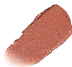
SM002 ニューシルエット New Silhouette