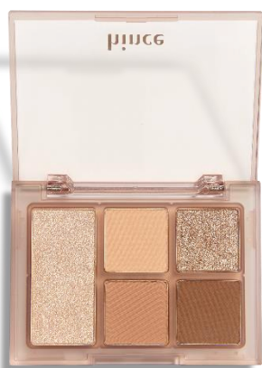
01 September セプテンバー

ふんわりとした早秋の 穏やかなムードを表現した トーンオントーン ベージュブラウンカラー