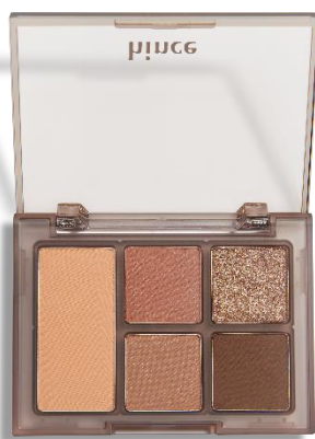
02 Late Autumn レイト・オータム

ふんわりとした早秋の 穏やかなムードを表現した トーンオントーン ベージュブラウンカラー