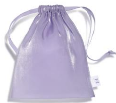
限定オーガンジーバッグ