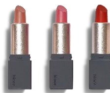
ムードインハンサーマットミニコレクション (左から、ムードインハンサーマット M002タイムレス、 M004ソフトデマンド、M006アバヴパッション)