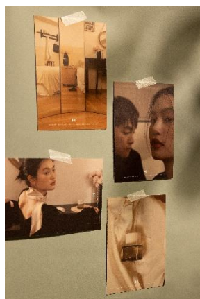
ポストカード （全4種）