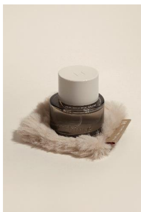
オードゥ パルフアム& ムードファーコースター