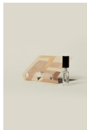
オードゥ パルフアム（2ml）