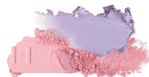
L003 Dreamlike ドリームライク