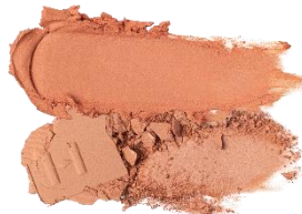
L005 Bare Harmony ベアハーモニー