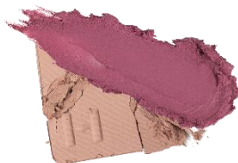
L004 Refinement リファインメント