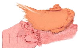
L002 New Symphony ニューシンフォニー