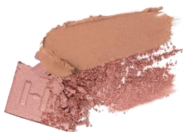
L001 Allure in the air アリュール・インザ・エアー