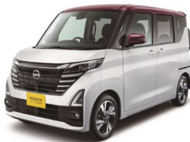
ハイウェイスターGターボプロパイロットエディション

URL： https://www3.nissan.co.jp/vehicles/new/roox.html